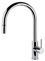
Monomando Camillo 8467 000