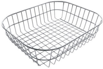
Cesta blanca de acero inoxidable 8611 000