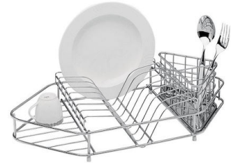
Rejilla portaplatos inox 8100 331